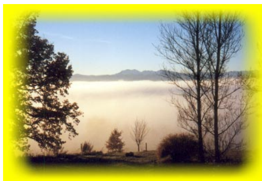
Un matin à Providence

Conditions idéales pour des groupes allant jusqu'à 12 personnes